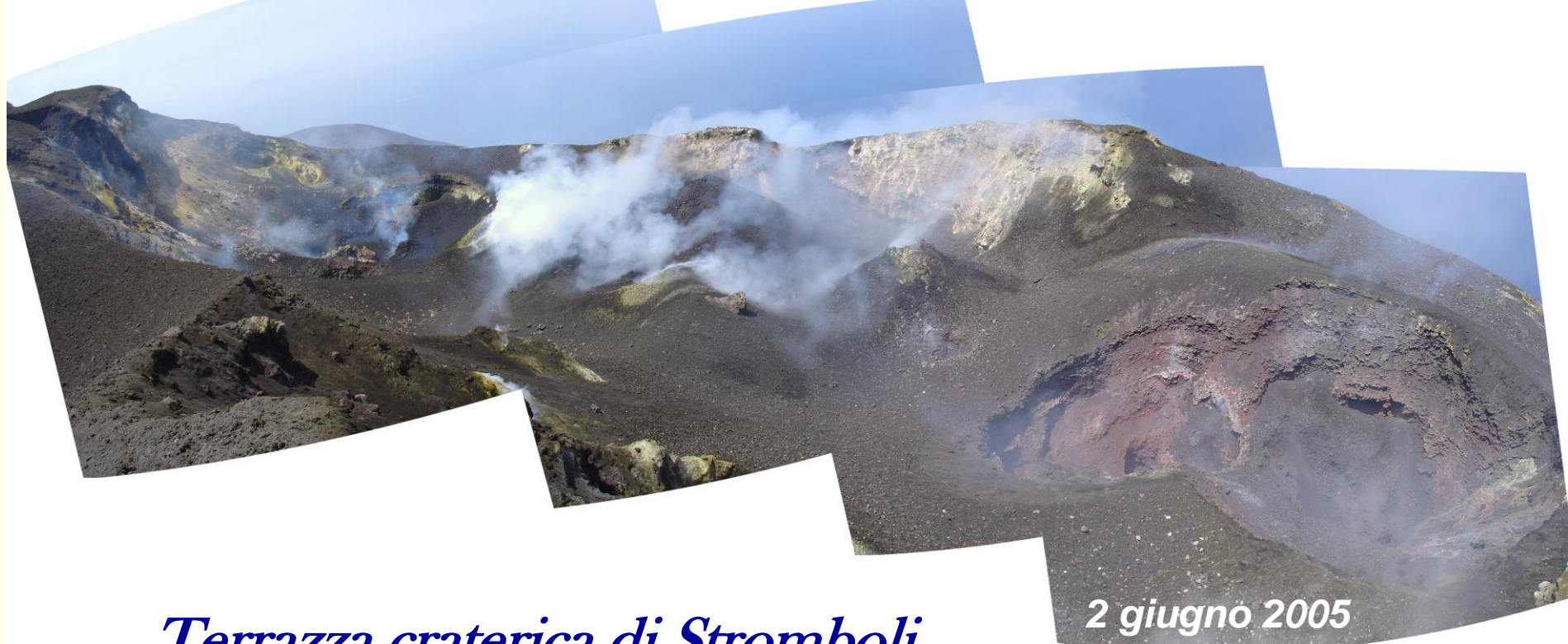
Terrazza craterica di Stromboli